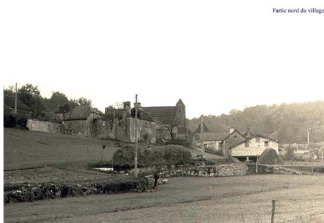
Partie nord du village