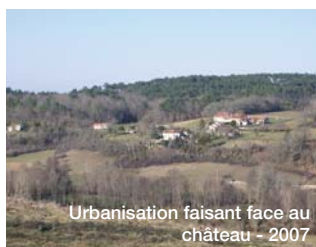
Urbanisation faisant face au château - 2007